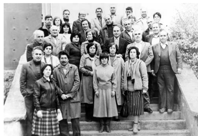
Учителският колектив на училището през учебната 1987-1988 г.