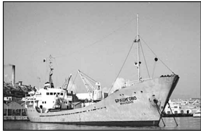
Моторен кораб „Брацигово“ в Малта, 1970 г.

само подробности, но и не-публикувани досега снимки, за което „Морски вестник“ му изказва своята искрена благодарност, а ние правим спомените му достойни на вас, читателите на в. „Април-