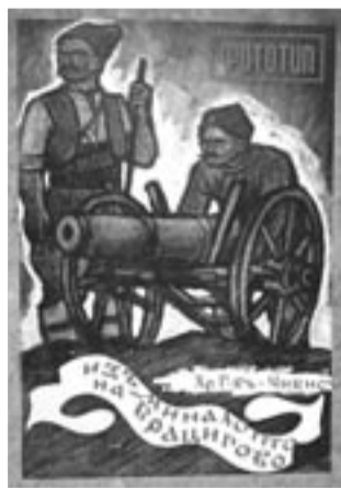
ФОТОТИП от 1940 г., 314 стр. - 6 лв.