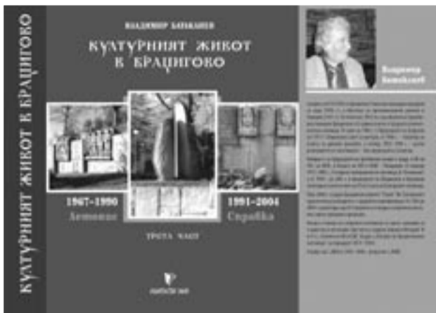
НОВА, Първо издание 596 стр. - 10 лв.