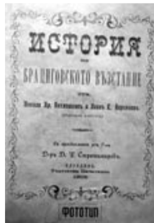
ФОТОТИП от 1905 г., 140 стр. - 4 лв.