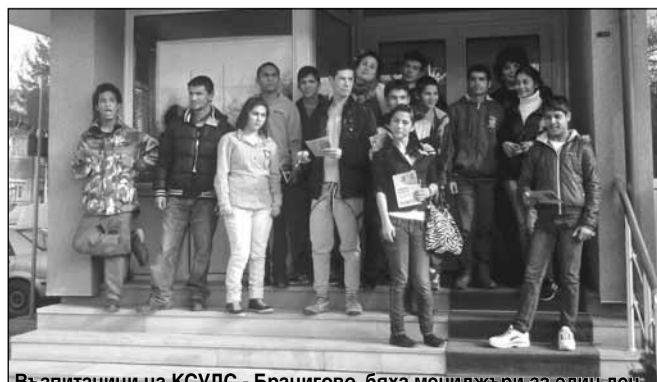
Възпитаници на КСУДС - Браçигово, бяха мениджъри за един ден