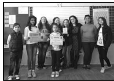
ВГ „Гама“ – ОУ „Христо Ботев“, с. Бяга

Всички деца бяха въодушевени от участието си в конкурса. Желанието им да победят бе силно и заразяващо. Увлъкоха и мен, изисквах да имат по-чести репетиции, не спираха да питат как се справят. По този начин те показаха отношение към певческото изкуство, мотивираха и мен като техен ръководител да дам всичко от себе си, за да се случи магията на сцената.