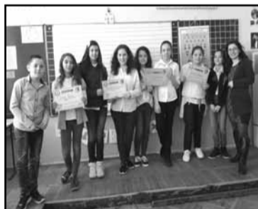
ВГ „Звездици“ – СУ „Народни будители“, гр. Брацигово