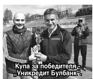
Купа за победителя - „Уникредит Булбанк“

Същевременно на градския стадион се проведе и тради-