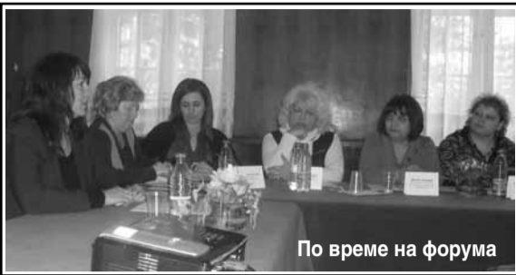
По време на форума

- От страница 1 В Дневния център е заложено провеждането на трудотерапия. Целта ѝ е чрез прилагане на различни форми на трудова дейност да бъде подпомогнато цялостното възстановяване на организма. Тя благоприятства за положителното развитие в емоционално-волевата сфера, както и на двигателните умения, за придобиването на знания, умения и ориентири относно заобикалящата среда. Основният принцип при организирането и провеждането ѝ е индивидуалният подход. Под внимание се взимат възрастта, заболяванията, потребностите и желанието на отделния човек. За да се постигнат целите на трудотерапията, се работи групово. Една група се занимава с плетиво - изработени са гети, чорапи, терлици, елещи, дамски и детски комплекти от шалове, шапки и ръкавички, а другата - с дърворезба, аранжиране на пана и вази от природни материали, сувенири от шишарки, вятърни мелници, цветя от царевица шума, рисунки върху дърво и камък. В момента тук се правят